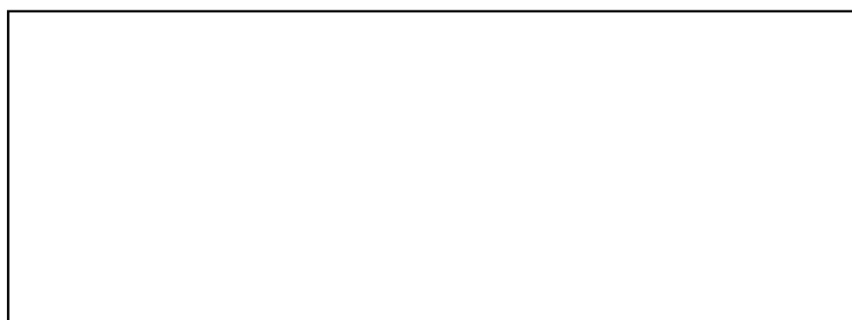
SUBCONTRATISTA (sello y firma)